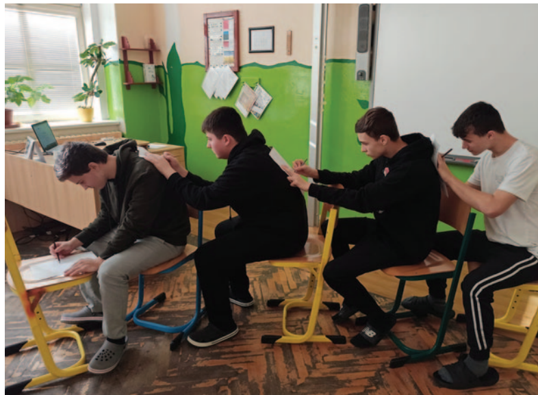
Mediální tým ZŠ Lidická

Vytvořili jsme prezentaci o počítačových hrách. Spolupracovalo se nám bez problémů. Představení prací v kině bylo zábavné, všechny děti poslouchaly a byla dobrá atmosféra.