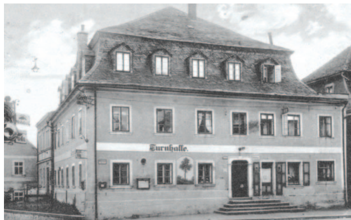
Pohlednice z roku 1925, kdy objekt patřil spolku Deutscher Turnverein