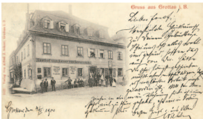
Pohlednice z roku 1900. V místech, kde jsou dnes obnovené malby s myslivcem a zeleným stromem můžeme vidět reklamu na točené pivo, sál a také volné pokoje.