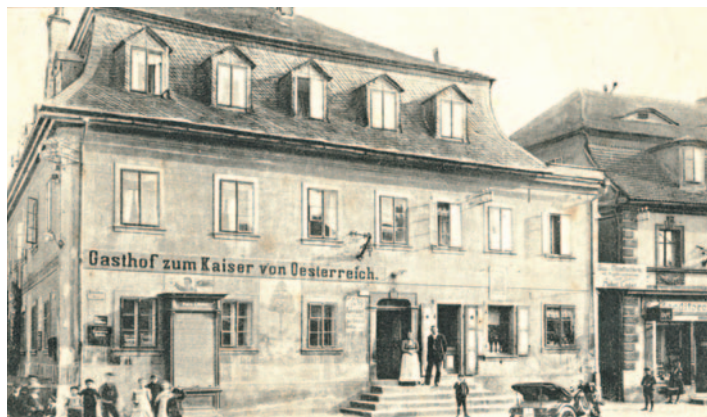
Pohlednice z roku 1913, kde už jsou patrné malby, které známe z současnosti

V roce 1990 se dům vrací městu. Z větších zásahů stojí za zmínku vybudování plynové kotelny v roce 1994, která je dnes ale nahrazena novou, moderní. A o tom se už více dočtete v úvodním článku HRÁ-DECKA, věnovaném sedmi letům rekonstrukce památkově chráněné Besedy. -vš-