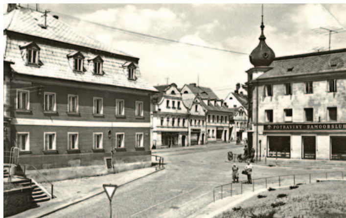
Beseda nároží. Snímek z šedesátých let 20. století