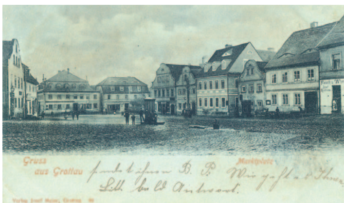
Celkový pohled na dnešní Horní náměstí s domem č. p. 124 v levé části. Pohlednice odeslaná r. 1899.