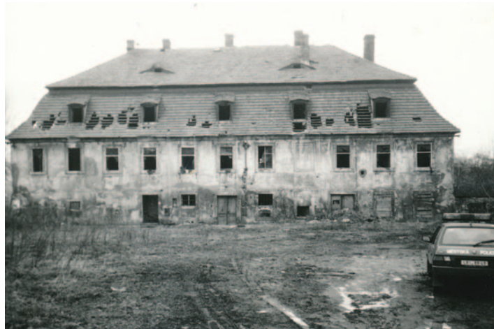
Fotografie z roku 1996