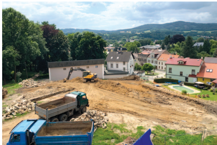
Současný pohled na místo po č. p. 65, 66