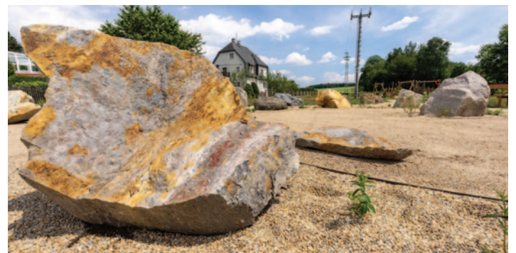
geopark Hrádek nad Nisou