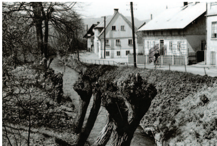
Náhon na začátku Luční ulice