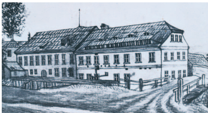
Kresba Starého mlýna z roku 1832, na které je patrný i náhon s mostem