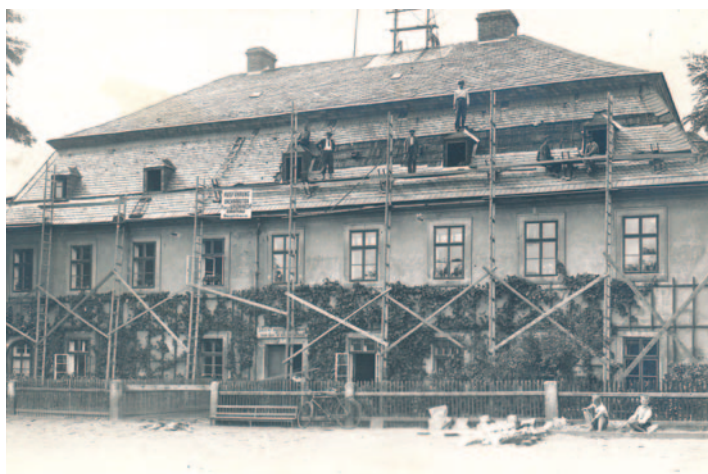
Nedatovaná historická fotografie Azylu