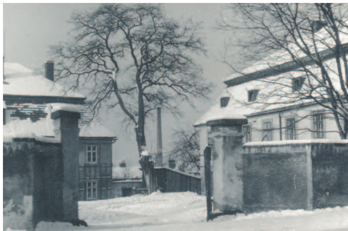
Nedatovaná historická fotografie Azylu

Po zřízení krovu a částečné demolicí č. p. 65 a 66 na jaře roku 2006 město mnohokrát řešilo, jak torzo objektu, a vůbec celou lokalitu, využít. Jako zásadní se jevila dohoda s Národním památkovým ústavem, protože objekt byl i přes svůj stav stále na seznamu kulturních památek ČR. Z toho také vycházela první architektonická studie Ing. arch. Libora Sommera, představená v roce 2013. Počítala se zachováním zdiva, jeho konzervací a nově založenou nástavbou ve