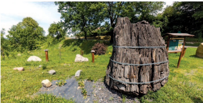
geopark Jasna Góra