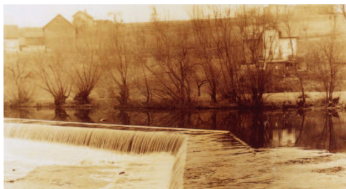
Jez v Doníně, ze kterého byla odváděna voda do náhonu