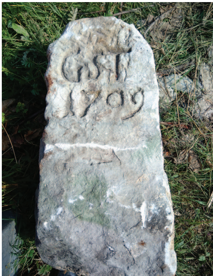
Hraniční kámen z roku 1709 nalezený ve zdivu Azylu