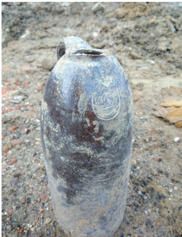
Zmetek hliněné láhve na libverdskou kyselku, nalezený v Azylu