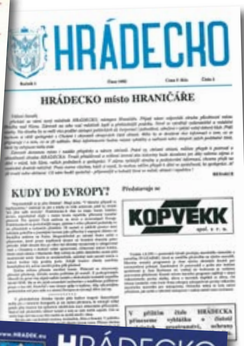
Obálka prvního čísla Hradeckého zpravodaje z ledna 1988. Hraníčář ze září 1990, ještě než byl vydáván městským úřadem. Historicky první číslo Hradecka z února 1992.