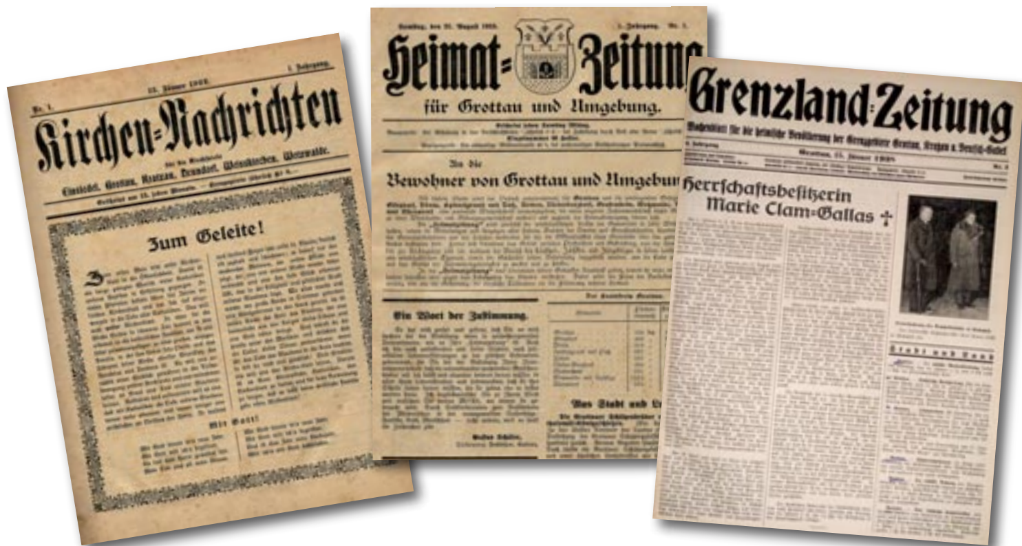
Úplně první číslo novin Kirchen Nachrichten z 15. ledna 1922, první číslo Heimat Zeitung z 25. srpna 1923, titulní stránka Grenzland Zeitung z ledna 1938

V únoru roku 1992 přichází na svět Hrádecko. Nový název vyhrál hlasování v redakční radě a nahradil Hraničáře, který byl vydáván řadou jiných měst. Noviny dostaly formát A4 a změnily tiskárnu. Ta umožnila HRÁDECKU zásadní proměnu. Zlepšila se čitelnost, najednou mělo smysl reprodukovat fotografie. Noviny se tehdy tiskly v Liberci u p. Tomáška. Do tiskárny už texty putovaly z počítače, byť byly externě prepisovány. HRÁDECKO dostalo jednobarevnou hlavičku s městským znakem, barvy se měnily po měsíci.