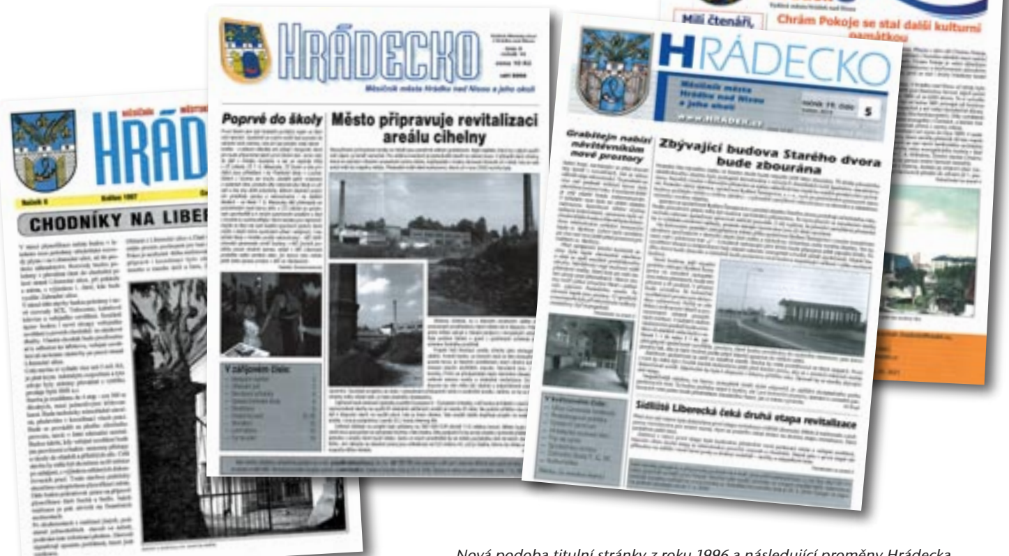
Nová podoba titulní stránky z roku 1996 a následující proměny Hradecka v letech 2003, 2006 a 2012

V dalších téměř třiceti letech se vzhled HRÁDECKA změnil ještě pětkrát. Od roku 1996 je hlavička plnobarevná a změnilo se v ní použité písmo, ke kterému se počínaje tímto číslem HRÁDECKA vracíme. Další proměnou prošel měsíčník Hrádku nad Nisou v roce 2003, v lednu 2006 a v únoru 2012.