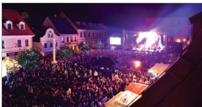
Náměstí v pátek večer opravdu praskalo ve švech.