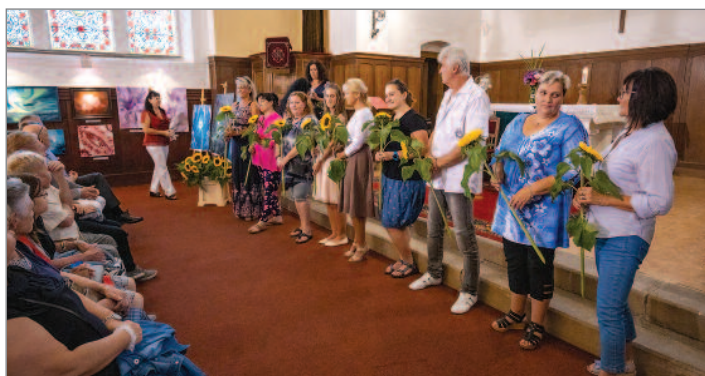
Hrádecké slavnosti tradičně začínají stran ruchu náměstí, v Chrámu Pokoje. Výstavu Hrádecký štětec, na které svá díla představují výtvarníci z Hrádku a okolí, připravuje spolek Ostrov života.