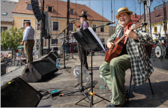
Mohlo by se zdát, že staropražské písničky skupiny Patrola Šlapeto zaujmou hlavně diváky seniory, ale opak je pravdou. Bavili se všichni. Nostalgičké, jindy veselé popěvky, i originální, často prostořecké vtipky, v neděli po obědě diváky dobře naladily.