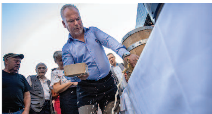
Stejně jako výstava, patří k pátečnímu podvečeru i narážení sudů s pivy z Čech, Německa a Polska. Letos se opravdu poctivě naráželo, každý ze zástupců měst s sebou dovezl dřevěný soudek.