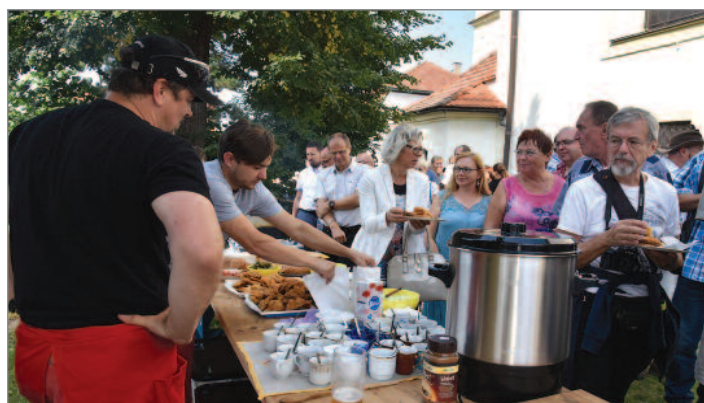
Nebývalo to v Hrádku zvykem, ale už je. Po mši svaté následuje setkání v kostele s něčím dobrým k zakousnutí i k napití.