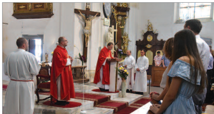
Neřední poutní mše svatá. Slavíme svátek patrona města, sv. Bartoloměje. Do kostela přicházejí i pěší poutníci z Raspenavy, kteří tak oplácejí podobnou návštěvu hrádeckých. A v kostele je plno.