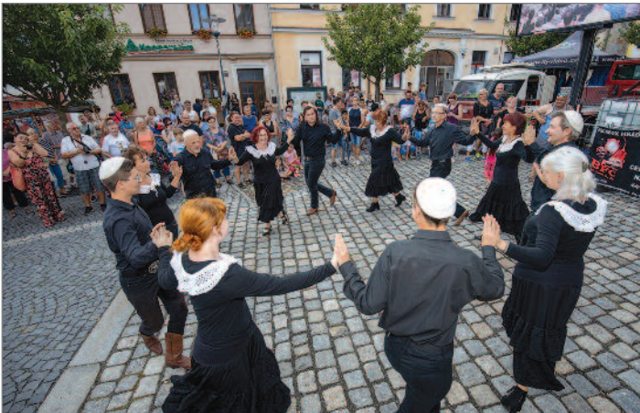
Taneční skupina Staří známi se na pomyslné cestě kolem světa inspirovala židovskou kulturou.