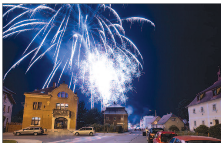
Poslední tóny koncertu Big 'O' Bandu přešly plynule v první výstřely ohňostroje. Po něm následovala diskotéka pod širým nebem.