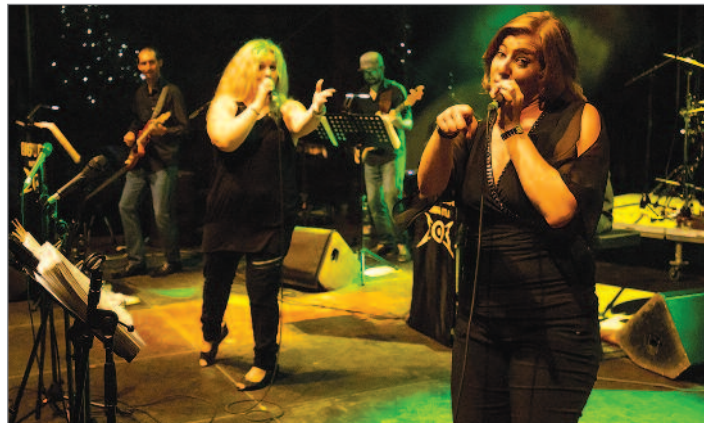
Big 'O' Band kdysi hrával na slavnostech v odpoledních časech. Ovšem kde jsou ty doby? Dnes kapela oprávněně baví publikum všech generací v hlavní době slavností.