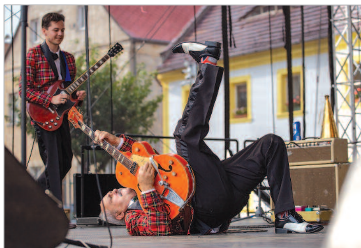
Kapela Crazy Dogs nás vrátila do počátků rock and rollu. A po několika písních postupně strhla i publikum, které tančilo pod podiem.