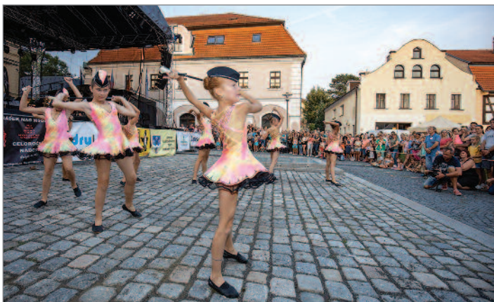
Hrádecké mažoretky představily na Horním náměstí v rámci slavností skupinové formace všech věkových kategorií. A krátce po slavnostech odcestovaly na mistrovství Evropy do Francie.