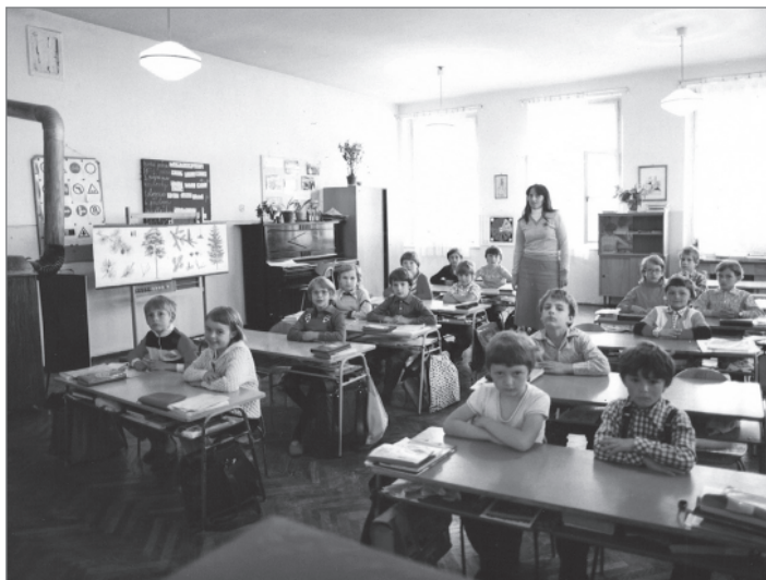
První a druhý ročník v ZŠ Václavice ve školním roce 1984/85

To je trochu problém. Jak já ráno chodím do školy před půl sedmou, tak spoustu bývalých žáků potkávám, když jdou na vlak. Oni už sice vyrostli, ale jak jsme se často potkávali a mýjeli, tak jim stále tykám. Když někoho ale léta nevidím a jen se občas potkáme ve městě, tak jim vykám, tam si nejsem jistá, jestli by jim tykáni nevadilo. Zatím nikdo nic proti neměl.