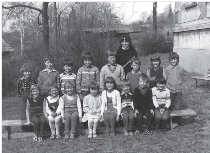
První a druhý ročník v ZŠ Václavice ve školním roce 1983/84

holčička, kterou když jsem viděla, tak jsem si přesně vzpomněla na žákyni, již jsem kdysi učila. Když jsem pak v červnu viděla obě najednou, šla jsem si do sborovny pro fotografii a ukázala jim ji. Dcera jako když mamince z oka vypadla.