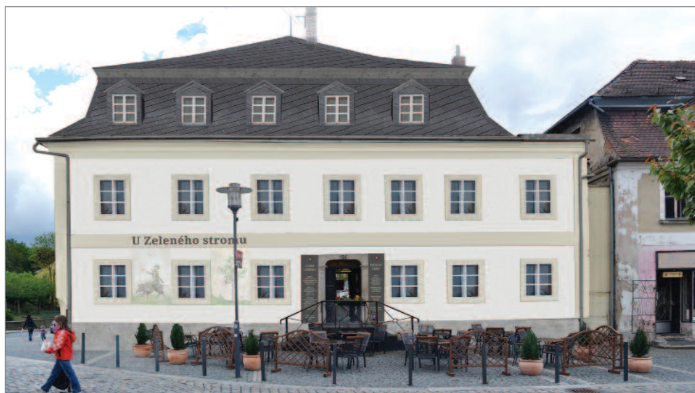
Jeden z možných návrhů nové podoby č. p. 124 na Horním náměstí

Vaše náměty, příspěvky a připomínky posílejte na e-mail: strupl@branatrojzemi.cz , tel./fax: 725 357 278 nebo písemně na MěÚ.