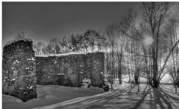
„Svatý Jakub u Jindřichovic 1“ od autorky Kateřiny Zajíčkové

Pro ty, kteří se nestihli soutěže zúčastnit, a pro další zájemce chystá Společnost pro kulturní krajinu druhou fotografickou soutěž drobných památek v Trojzemí, která bude probíhat od 1. 6. 2017 do 15. 8. 2017. Všechny potřebné informace a soutěžní podmínky budou včas zveřejněny na internetových stránkách projektu v sekci Aktuality.