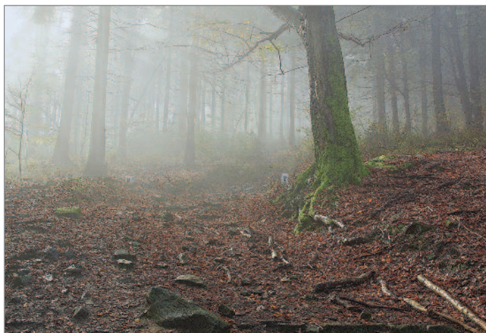
Nálada z hraniční cesty na Hvozď