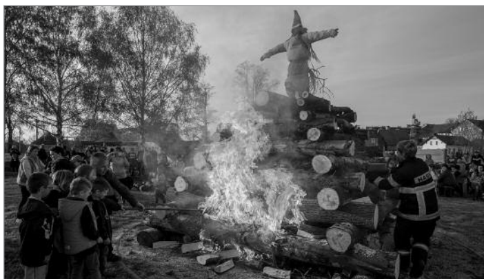
K tradicím přelomu dubna a května patří pálení čarodějnic