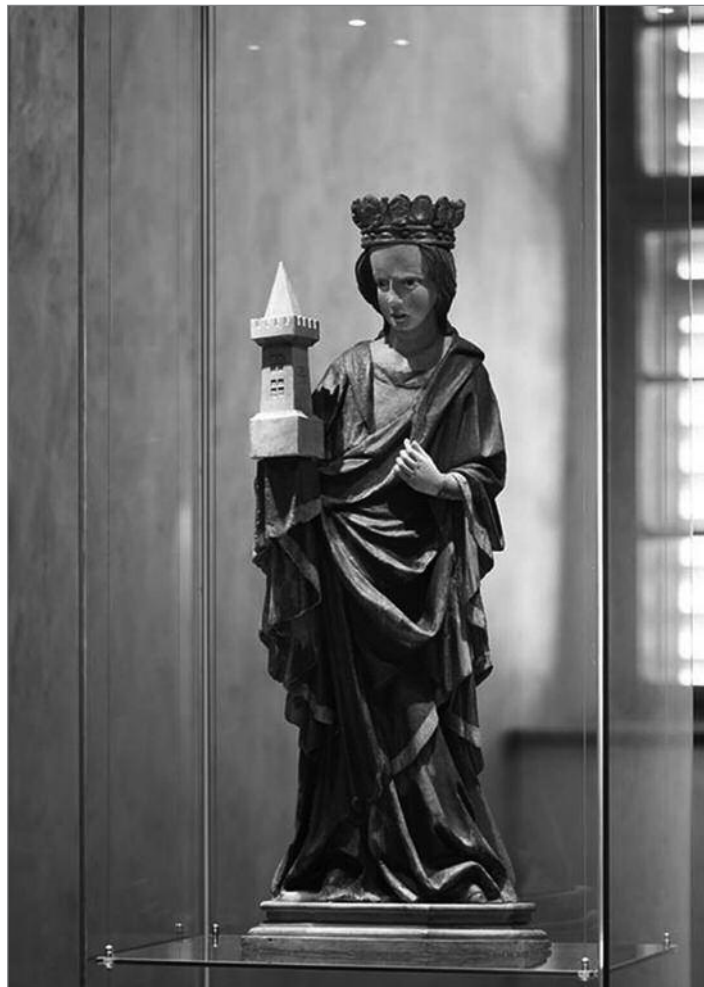
Originální socha sv. Barbory

Na sklonku loňského roku byla vydána nová publikace, ve které jsou shrnuty nejnovější poznatky o hradě a jeho historii. V knize můžete absolvovat prohlídkové okruhy, její součástí je bohatá obrazová dokumentace. Knihu můžete zakoupit na hradě Grabštejn nebo v Bráně Trojzemí.