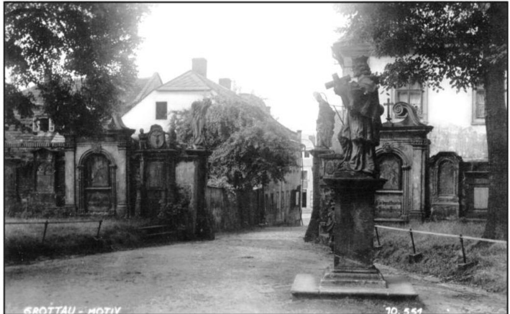
Město usiluje o získání několika dotací. Jedním z projektů je Paměť v krajině, který zahrnuje i restaurování soch a křížové cesty u kostela.

j pozemků (2,0), převody kanalizace (0,75) j nemovitého majetku, bytů a nebytových or (0,6)