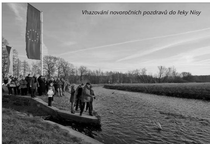
Vhazování novoročních pozdravů do řeky Nisy