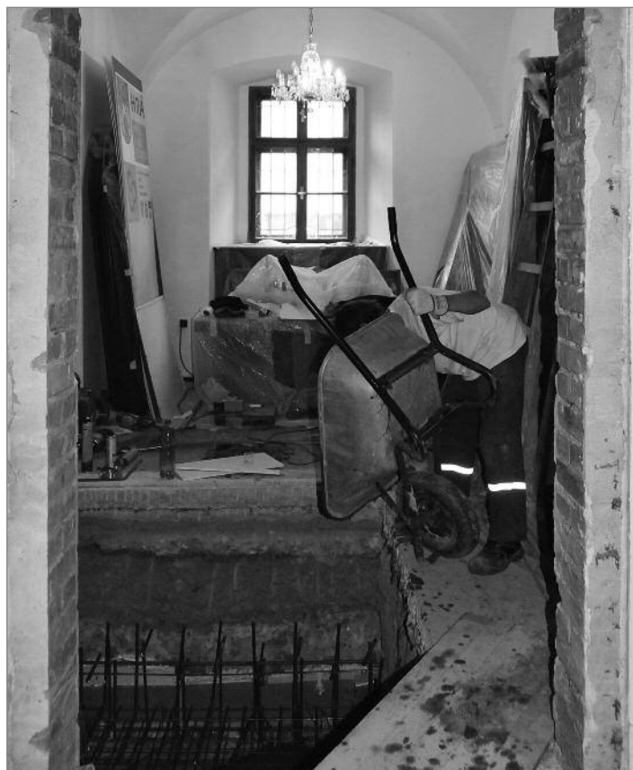
Budování základů výtahu v přízemí městského úřadu