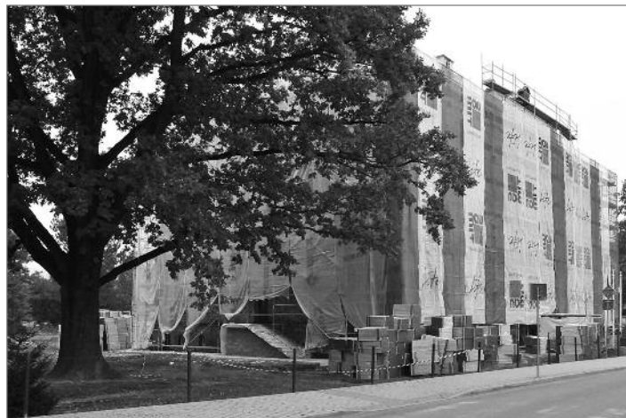
Budova Základní školy praktické v Loučné pod lešením

A konečně začala vestavba výtahu v budově hrádecké radnice. Provoz radnice tím není výrazně omezen. Jen je potřeba se připravit na možnou zvýšenou prašnost a případně hluk. Výtah usnadní přístup do jednotlivých pater budovy nejen imobilním občanům, ale všem, pro které mohou být schody aktuálně překážkou. Součástí projektu bezbariérové radnice bude i automatické otevírání vstupních dveří do budovy úřadu.