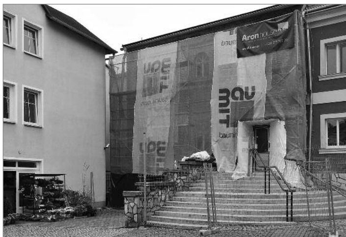
Rekonstrukce průčelí DK Beseda

Zatímco dvě největší prázdninové stavby – snížení energetické náročnosti budovy školy v Doníně a rekonstrukce chodníků v ulici Generála Svobody byly v září prakticky dokončeny, další nové stavby začaly. Místo donínské školy se ocitla pod lešením budova školy v Loučné. Až budou práce na zateplení fasády a výměně zbylých oken dokončeny, bude 111 let stará školní budova zářit do širokého okolí tak, jak si zaslouží. Její vzhled byl dlouhodobě z hrádeckých školních zařízení nejhorší. Ač probíhá zateplování fasády, budou i v Loučné, stejně jako v Doníně, zachovány všechny zdobné prvky. Zatepleno bude také podkroví a strop suterénu. Zároveň se u školy v Loučné začala připravovat zcela nová školková zahrada. Další revitalizace zahrady probíhá u Mateřské školy na Liberecké ulici.