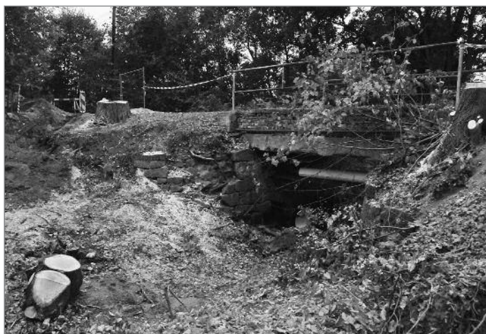
Rekonstrukce mostku v ulici Na Hrázi

Jen pár desítek metrů od školy v Loučné začala rekonstrukce mostku v ulici Na Hrázi. Pokračovat bude až do prosince letošního roku. Do té doby musí řidiči volit jinou cestu do Nové Loučné.