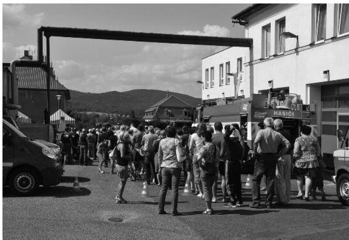
Na hasičský guláš se tradičně stojí fronty.