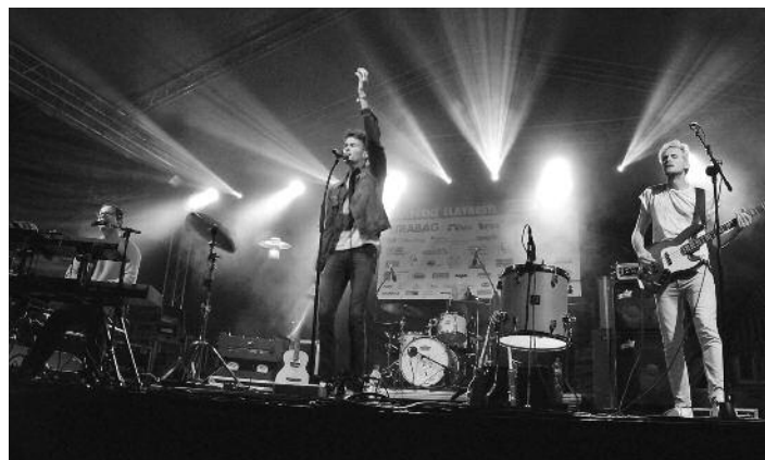
Hvězdou sobotního večera, za kterou se sjely fanky z širokého okolí, byli několikanásobní držitelé Andělů Charlie Straight.