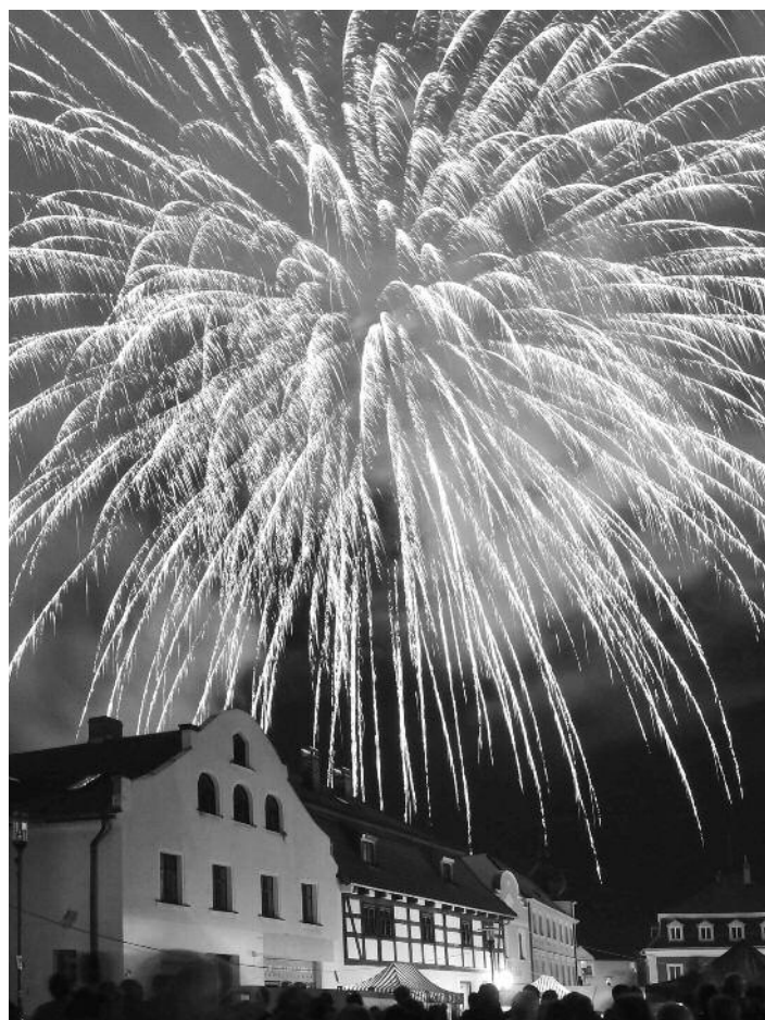
Náměstí rozzářil ohňostroj, tentokrát s hudebním doprovodem Vanessy Mae.