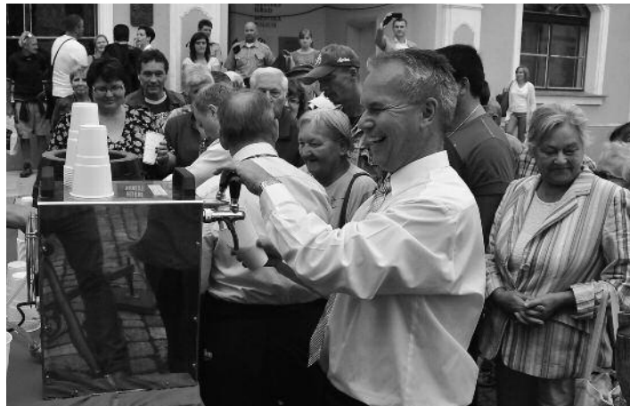
Ke slavnostem patří narážení sudů s pivy ze tří zemí. Poprvé jsme měli možnost ochutnat pivo z malého polského pivovaru, Německo zastupovalo žitavské pivo a Čechy svijanská klasika.