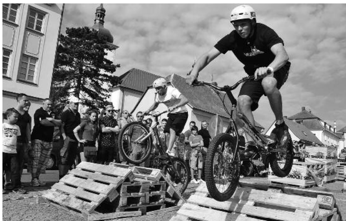
Umění kluků, kteří na kole na čas zdolávají pro někoho neschůdné překážky, obdivovaly desítky lidí.