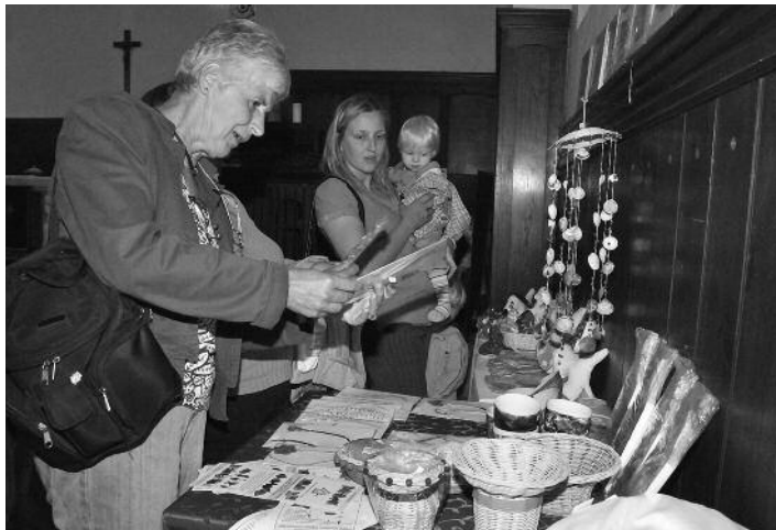
Městské slavnosti byly zahájeny v Chrámu Pokoje. Po tři dny zde vystavovaly a prodávaly své výrobky chráněné díly z Liberecka, ale také z jižních Čech.