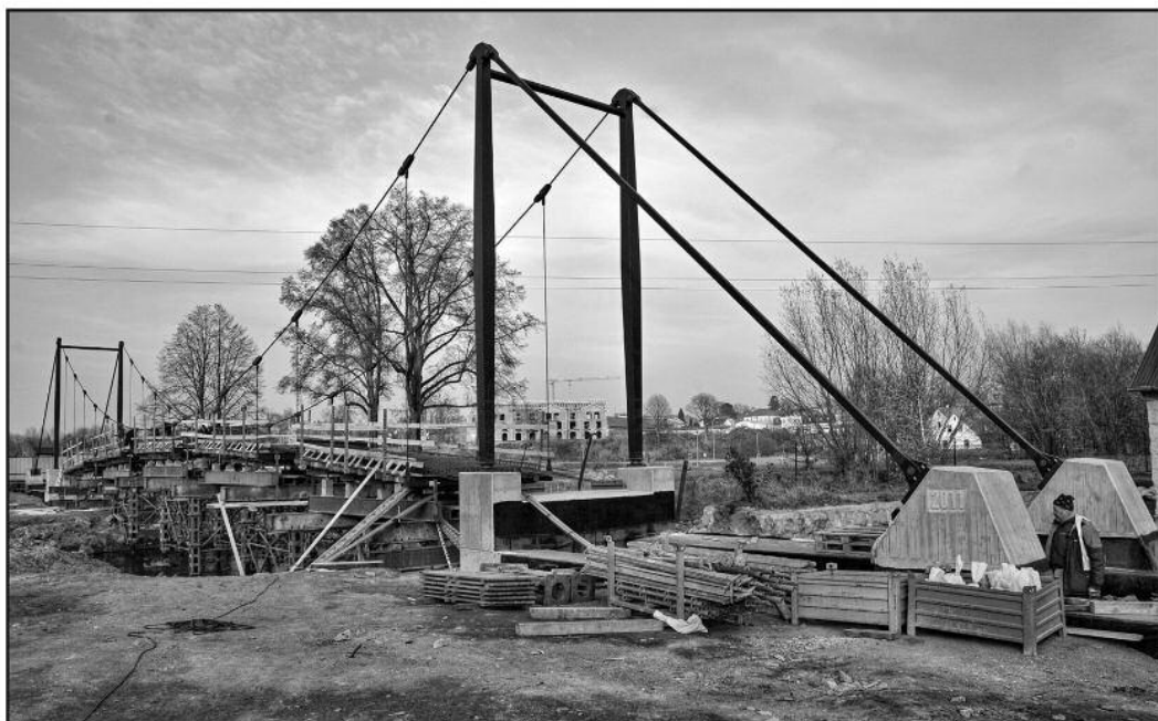
Nová lávka u Koruny

prodeje pozemků (4,0), prodej bytů (5), prodej rekre. zařízení (0,25) ad.