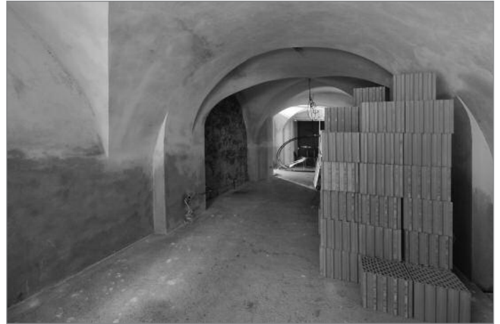
Výstavní a setkávací prostory v přízemí domu. Klenutá místnost bude využita především k prezentaci historie hrážděného domu č. p. 71