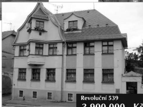
Revoluční 539 3.900.000,- Kč