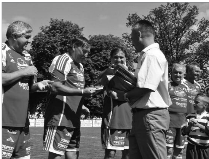
Na hřišti se po roce ocitl také Mistr Evropy Antonín Panenka