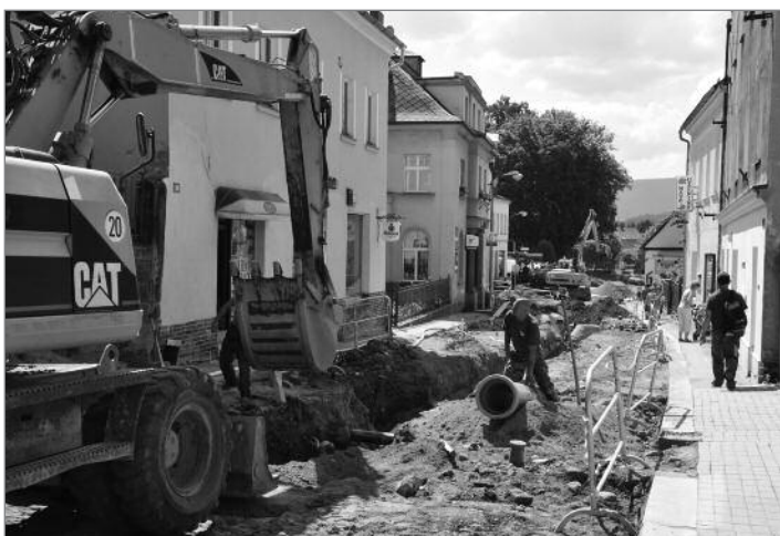
Pokračující práce v ul. 1. máje