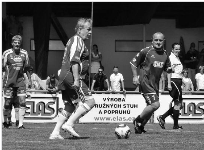
Na hřišti se vystřídala řada známých tváří včetně populárního Karla Šípa