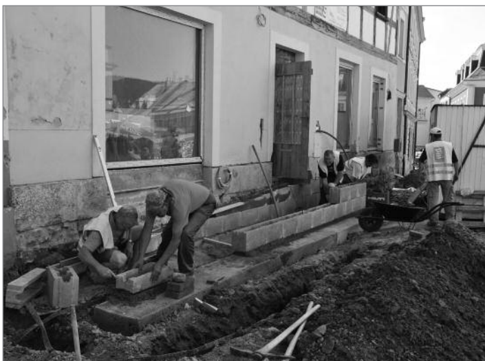
Bezbariérový vstup do multifunkčního centra

Stavba postupuje podle nového harmonogramu, zveřejněného v minulém čísle HRÁDECKA. Do městských slavností by tedy měly být dokončeny rekonstrukce Horního náměstí, ul. 1. máje, Liberecké, Husovy i Anglické. Osazen bude i nový mobiliář v podobě laviček a odpadkových košů. Funkční by měla být i fontána. Po pouti budou zbývat k dokončení jen některé architektonické prvky a ulice Lutherova a Tichá.