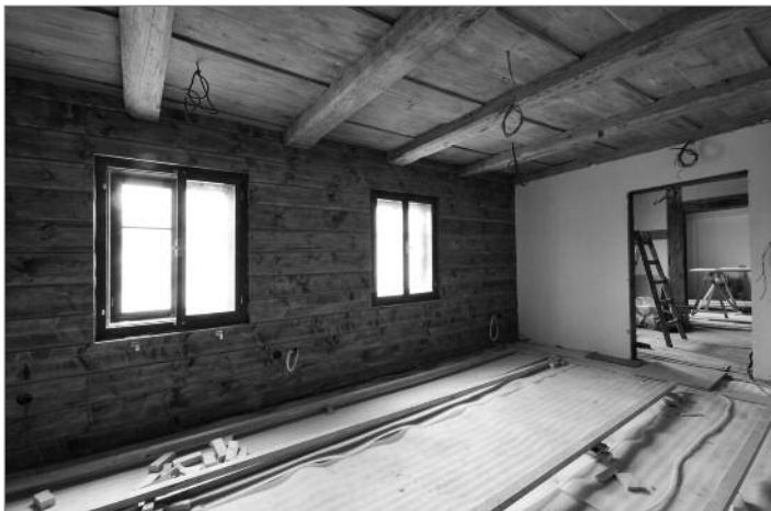
Jeden z výstavních prostorů v 1. patře domu