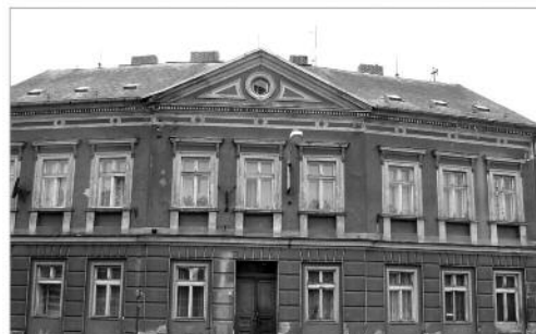
1. Máje 4.500.000,- Kč