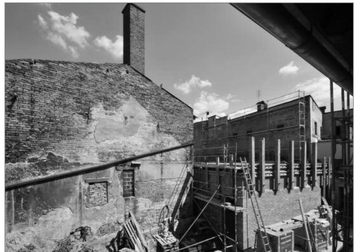
Pohled na přístavbu, ve které bude umístěn multifunkční sál