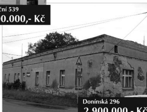
Doninská 296 2.900.000,- Kč