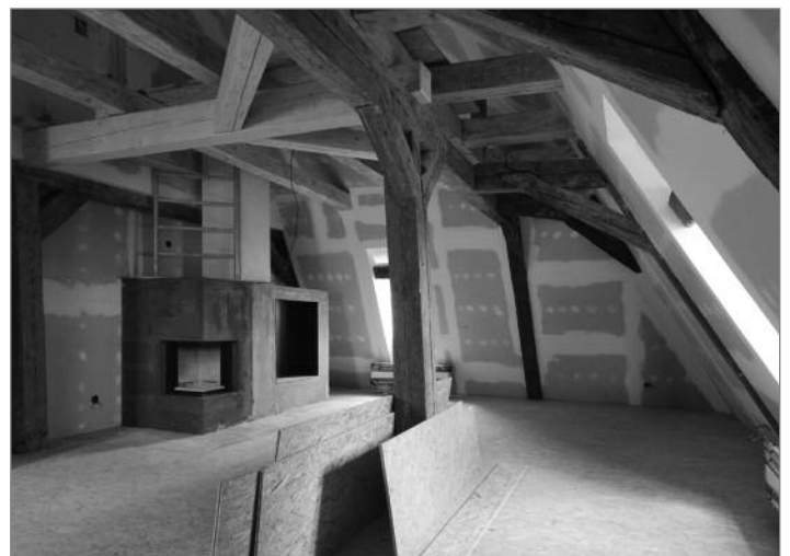
Podkrovní malý sál, určený pro setkávání laické i odborné veřejnosti