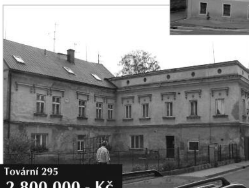
Tovární 295 2.800.000,- Kč