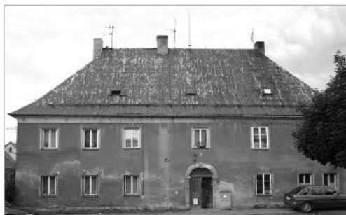
Dolní náměstí 51 2.300.000,- Kč