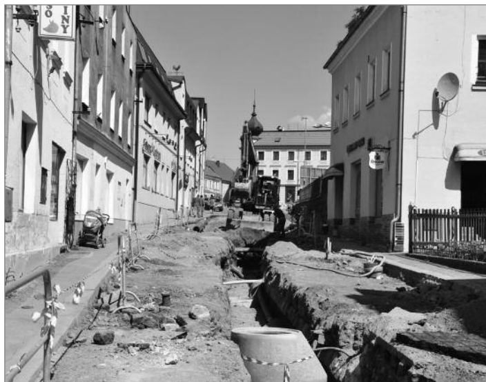
Pokračující práce v ul. 1. máje