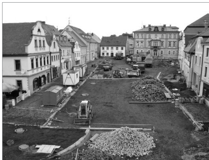
Na Horním náměstí zbývá položit dlažbu a osadit mobiliář