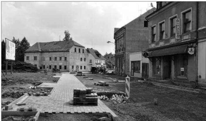
V dolní části ulice 1. máje se dláždí povrchy chodníků

V místech, odkud jsou viditelné věže obou hrádeckých kostelů, budou v dlažbě umístěny sluneční hodiny. Stín, ukazující za slunečného počasí čas, bude vrhat člověk, který se postaví na vyznačené místo.