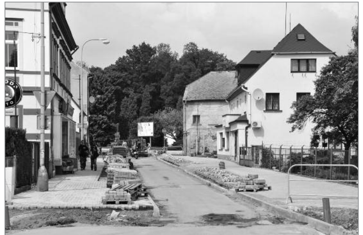
V dolní části ulice 1. máje se dláždí povrchy chodníků

Dalším z prvků, který bude odkazovat na historii města, bude „časová osa“ vydlážděná ze světlého kamene napříč celým náměstím. Povede přibližně v ose historické úvozové cesty, odkryté v zimě při archeologickém průzkumu náměstí. Podél časové osy bude původní dlažbou z různých historických období vydlážděno pět čtverců. Nejstarší, vydlážděný z valounů úvozové cesty ze 17. století, bude v horní části náměstí. V dalším čtverci bude dlažba z roku 1749, kdy byla úvozová cesta zasypána. V dolní části náměstí bude umístěn čtverec dlažby, která tvořila povrch náměstí ještě vloni na podzim.