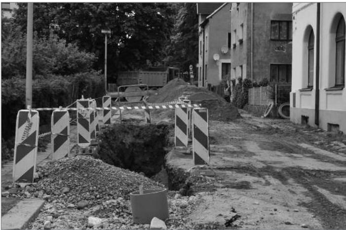
Práce začaly ve Školní ulici

Jedním z nejatraktivnějších prvků se jistě stane historická studna, která byla archeology odkryta na začátku května. Její stáří je odhadováno na minimálně 400 let. Může být ale ještě starší, což potvrdí až probíhající archeologický průzkum. Vzhledem k ojedinělosti studny bylo rozhodnuto o jejím zachování a o jejím prezentování v nové podobě náměstí.