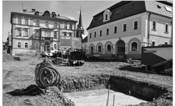
Základ budoucí fontány na Horním náměstí

Studna je hluboká minimálně 6 metrů. Při otevření se hladina vody nacházela v hloubce tři metry. V celé své hloubce je studna zpevněna kamennou obrubou zakončenou pískovcovým zhlavím. Konstrukce obruby je samonosná a do dnešních dnů se zachovala ve výborném stavu. Na starých pohlednicích z přelomu minulého století je před radnicí vidět pumpa. Pískovcové bloky, které ji zakrývaly, byly odstraněny 17. května. Poté archeolog Petr Brestovanský provedl první průzkum. Při něm se mimo jiné ukázalo, že studna je zásobována velmi vydatným zdrojem podzemní vody.