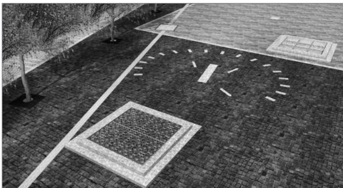
Začlenění architektonických prvků do dlažby náměstí. Atrakcí náměstí se stanou fontána (v popředí), vedle ní sluneční hodiny a historická studna (vpravo).