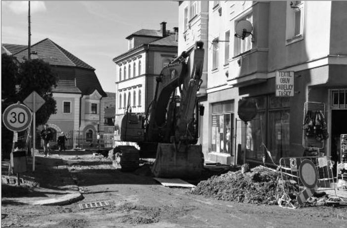
V Lutherově ulici pokračuje pokládání nové kanalizace

Výsledkem rekonstrukce Horního náměstí bude jeho zcela nová podoba s řadou atraktivních prvků. Mezi nimi budou prvky moderní, například fontána či sluneční hodiny. Stejně tak zde ale najde místo prezentace historie města, která byla odkrývána v průběhu archeologického výzkumu.