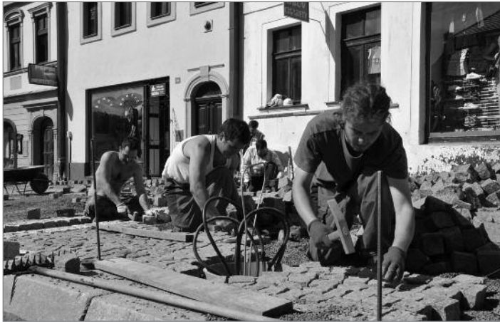
Na náměstí se už pokládá dlažba

V místech, odkud jsou viditelné věže obou hrádeckých kostelů, budou v dlažbě umístěny sluneční hodiny. Stín, ukazující za slunečného počasí čas, bude vrhat člověk, který se postaví na vyznačené místo.