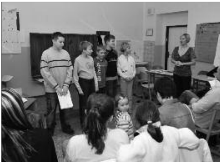
Šestáci čekal těžký úkol: prezentovat svou práci nejen před spolužáky, ale i rodiči