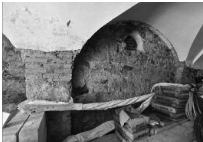
Patrně nejstarší část domu se nachází v dřívější prodejně pečiva

V březnu se vrátí stavební ruch i do dvora domu, kde se začne s výstavbou multifunkčního sálu. Postup prací zatím odpovídá tomu, že celý objekt bude otevřen v plánovaném termínu v září letošního roku. Vít Štrupl