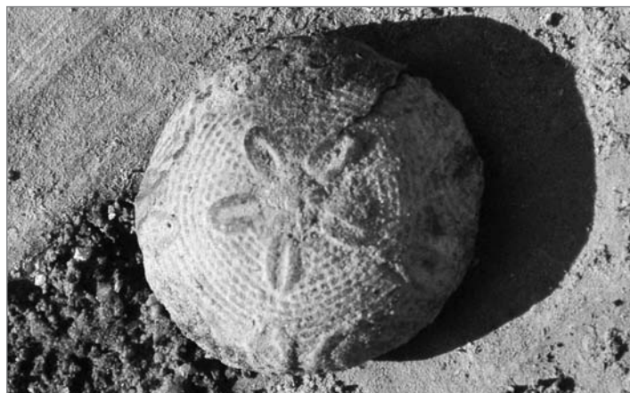
Jedním z mnoha nálezů byl kovový knoflík s dřevěnou výplní