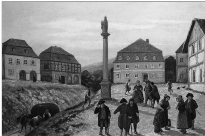
Obraz, na kterém je zachycen úvoz. Stav mezi lety 1714 a 1749.

V dalších dnech se archeologové postupně dostávali jednotlivými vrstvami až do hloubky přes tři metry. Vrstvy, tvořené různobarevnou hlínou a jíly, jsou v sondách dobře patrné. Nalezené střepy keramiky, skla, kosti i kovové materiály se budou ještě přesně datovat, pocházejí z různých epoch. Nalezeny zde ale byly i střepy nádob z doby bronzové, staré asi tři tisíce let. Většina nálezů, kterých jsou již desítky krabic od banánů,