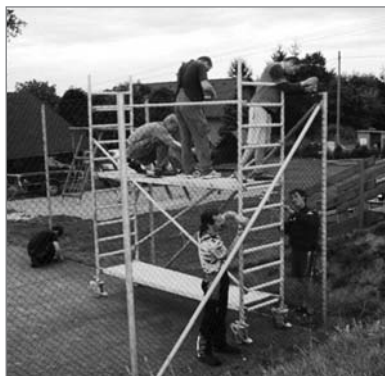
Hasiči opravili oplocení hřiště

Po roce používání víceúčelového hřiště na Dolním Sedle bylo jeho oplocení poškozeno natolik, že hrozil jeho pád. Několik nadšenců si půjčilo od firmy Status, a. s., na jeden sprnový víkend lešení a vlastními silami oplocení opravilo.