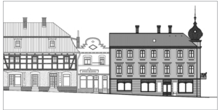
Návrh rekonstrukce fasád. Největší změnou projde rohová část domu. Barevné vyobrazení najdete na www.hradek.cz .