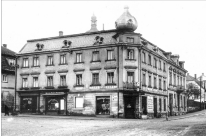
Dům po přístavbě patra a věžičky. Z této podoby vychází projektová dokumentace pro současnou rekonstrukci.

Ten byl postaven po roce 1925. Architekt mu tehdy vtiskl podobu se secesními prvky, která se zachovala dodnes. Svoji podobu si zachovala i sousovní část. Největší objekt byl ale po válce necitlivě rekonstruován, fasáda ztratila téměř všechny původní prvky a dnes je téměř plochá, bez členění.