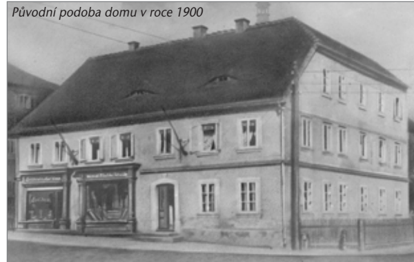
Původní podoba domu v roce 1900

Město je vlastníkem čtyř domů na náměstí. Kromě samotné radnice a domu kultury Beseda to jsou ještě domy č. p. 70 a 71. Dům s hrázděním (č. p. 71) čeká letos rozsáhlá rekonstrukce, která jej přemění v Multifunkční centrum Trojzemí. Zkrátka ale nepřijde ani sousední dům č. p. 70, na kterém bude letos opravena fasáda a okna.