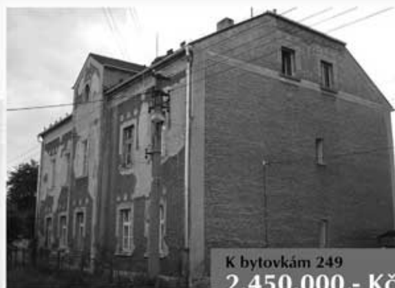
K bytovkám 249 2.450.000,- Kč