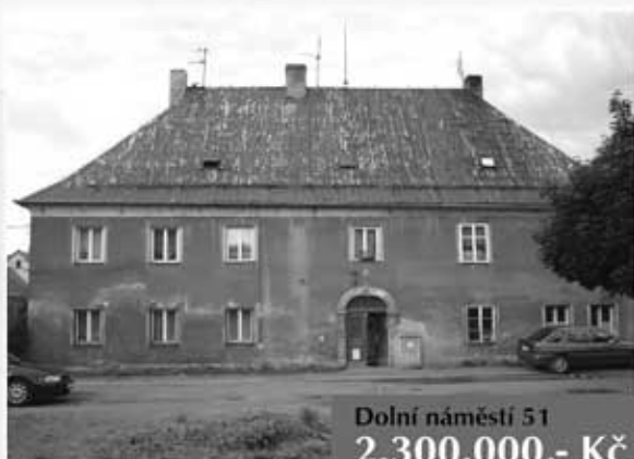
Dolní náměstí 51 2.300.000,- Kč