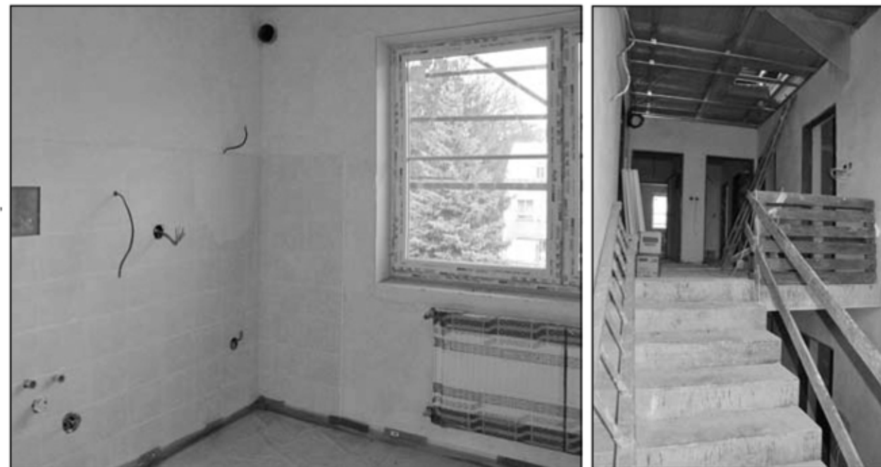
V ulici 1. máje pokračuje výstavba 36 bytů. K nastěhování by měly být v průběhu května.

Na výkon státní správy (2,927), na školství (1,273), soc. dávky (3,5), další dotace ze státního rozp. (0,5), převody z Národního fondu - projekty (4,917). Výstavba 36 bytů v ul. 1. máje (3,586), rekonstrukce mostu U Wienerů (0,689), Stromy v Trojzemí (0,425), dotace od obcí - na městskou policii a na žáky (0,48), Malý Trojúhelník - spolupráce měst (0,217), krajská dotace na projekty (0,08)