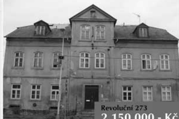
Revoluční 273 2.150.000,- Kč