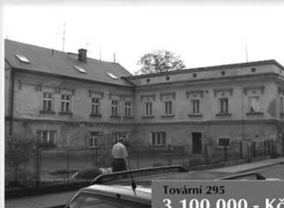
Tovární 295 3.100.000,- Kč

V případě zájmu o prohlídku objektu a pro další informace nás kontaktujte