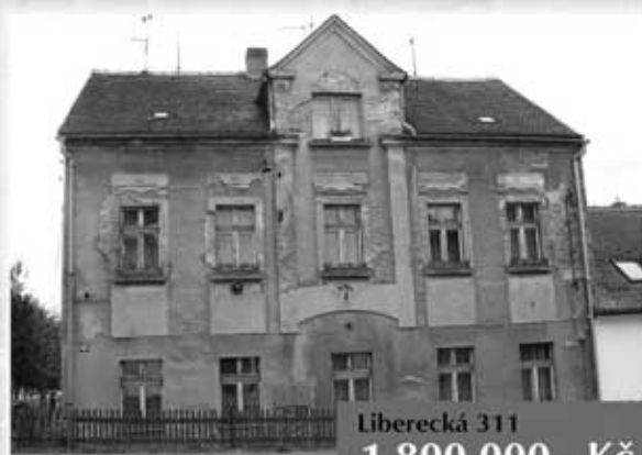
Liberecká 311 1.800.000,- Kč