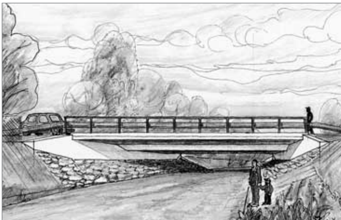
Oba břehy Nisy v Loučné u Wienerů jsou opět spojeny. Most bude dokončen do začátku prosince. Na konci října byla do tělesa budoucího mostu uložena armatura a následně probíhalo betonování. Po nutné technologické přestávce budou práce na dokončení mostu pokračovat na konci listopadu. Přinášíme obrázek konečné podoby mostu.