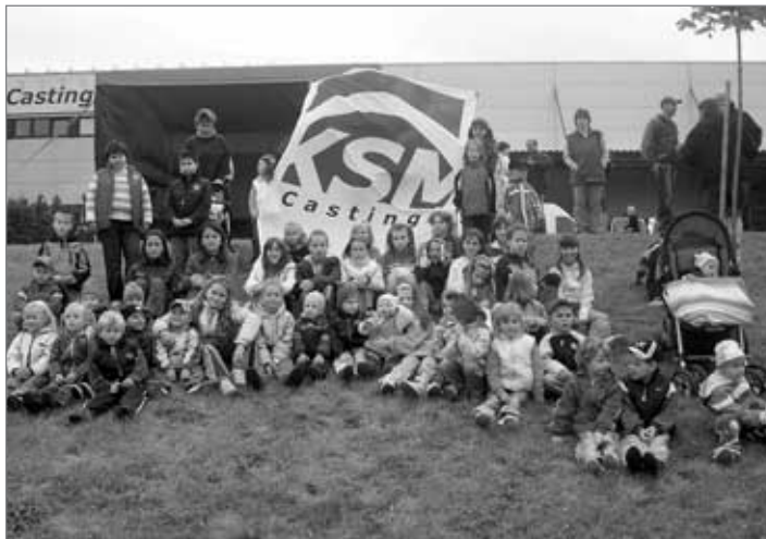
Společnost KSM Castings organizovala pro děti svých zaměstnanců loučení s prázdninami.

Trelleborg Fluid Solutions Czech Republic, s. r. o., je dceřiným závodem stejnojmenného švédského koncernu. Výroba hadic v hrádeckém závodě byla zahájena už na počátku 90. let minulého století. Závod v současnosti zaměstnává více než 550 lidí.