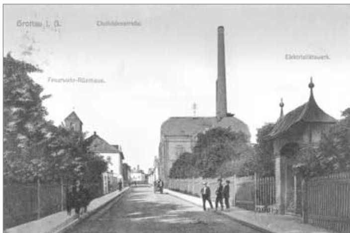
Dříve se tato ulice jmenovala Clothildenstraße – Klotyldina ulice. Dnes i dříve tam bývala hasičská zbrojnice. Továrna, kterou vidíme na pozadí vpravo, už tam nestojí, dříve to byla slévárna. Na jejím místě se v současné době má stavět market Plus.

Co nám projekt přinesl? Kromě toho, že jsme vytvořili výstavu včetně její elektronické podoby, jsme se především učili mnoha dovednostem na poměrně zajímavém tématu. Ať už šlo o dovednosti související s výpočetní technikou (fotografování digitálním fotoaparátem, scanování, úprava fotografií), nebo s českým jazykem při psaní popisek. Projekt při své realizaci ale přesahoval i do dalších předmětů.