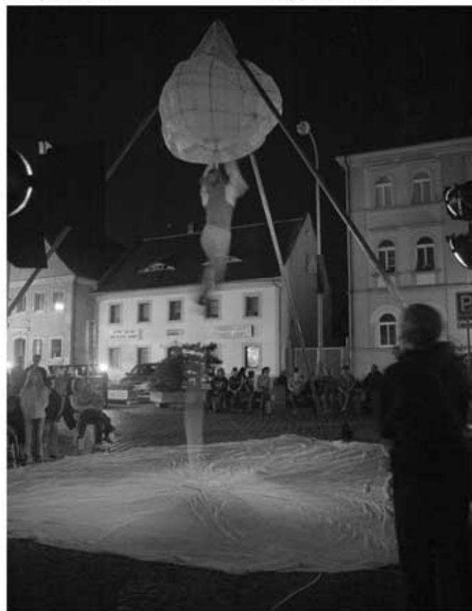
Festival alternativní, etnické hudby a divadla Worldfest se letos konal již počtvrté na Grabštejně. Zahájen byl 1. zářím na Horním náměstí divadelním představením.