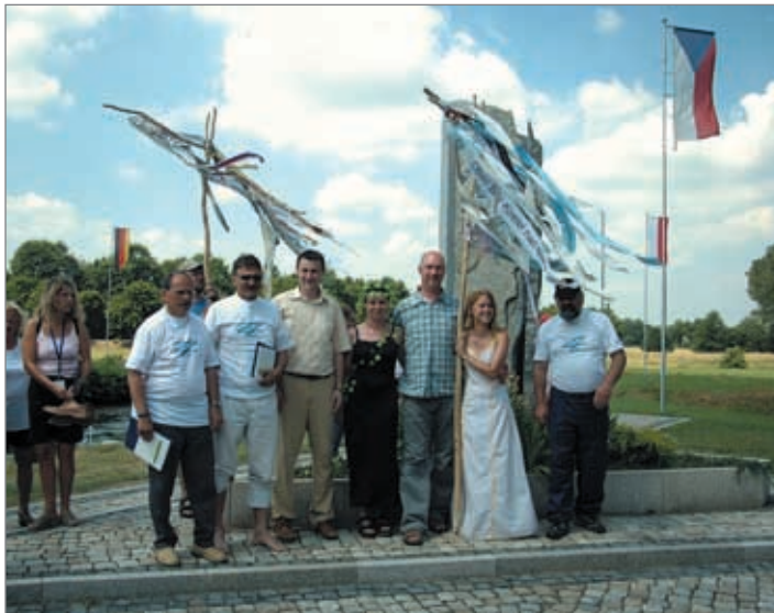
Víla Nisa se po roce opět objevila u pramenů Nisy, aby na lodi překonala celý její tok na českém území a pozdravila obyvatele měst na řece. Plavbu ukončila na Trojzemí, kde předala své poselství dalším městům za hranicemi.