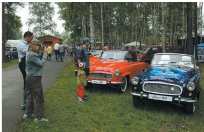
V areálu rekreačního areálu Kristýna proběhl celostátní sraz majitelů škodovek. Nadšení s jakým majitelé pečují o své letité poklady, zaujalo nejednoho návštěvníka. Mnozí si domů odnášeli náhradní díly, mající pro majitele dnes již leckdy historických vozidel hodnotu pokladu.