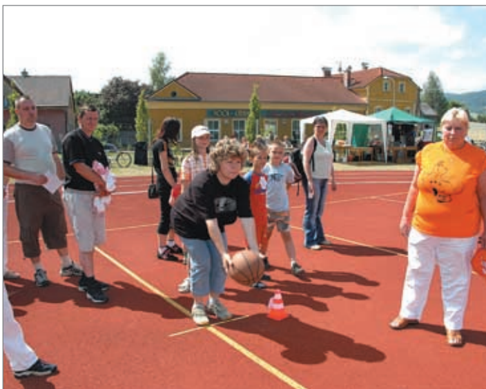
Hrádecký rodinný čtyřboj se konal poprvé a stal se jakousi předeherou rodinných her, které DDM Drak chystá na začátek září.