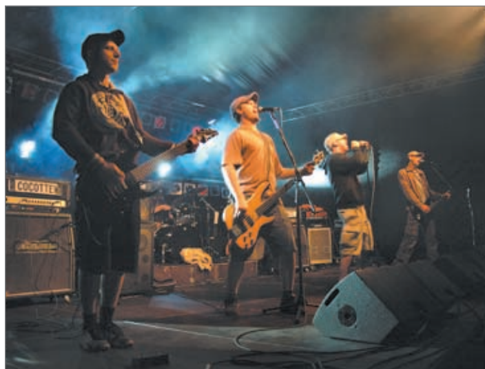
Čtvrtý ročník Hrádeckého rockového léta proběhl na Kristýně. Před osmi sty návštěvníky se na dvou pódiích vystřídalo od odpoledne do nočního hodin patnáct kapel. Rocková přehlídka opět povyrostla o stupínek výše.