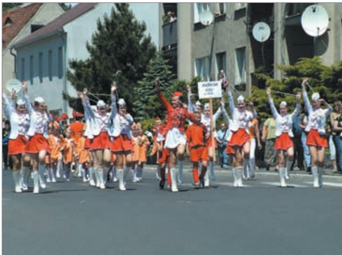
Na 1. ročník hrádecké přehlídky mažoretek se sjelo téměř 150 dívek. Při jejich průvodu městem i cvičení na hřišti zůstalo jen málo očí suchých.