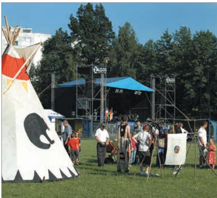
Letošní Oslavy Trojzemí pořádala polská Bogatynia. Hrádek nad Nisou reprezentovaly Bambulačky, Gipsy Klauns a Fit Studio. Při slavnostním zahájení byla otevřena výstava umělců regionu s fotografiemi Petra Mayera.