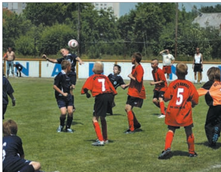
5. ročník turnaje pro nejmladší fotbalisty pořádal TJ Slovan. Na hřišti v Doníně se utkalo 7 týmů z Čech a Polska. Ve třicetistupňovém vedru se elévové vydali ze všech sil. Hrádečtí nakonec skončili pátí.