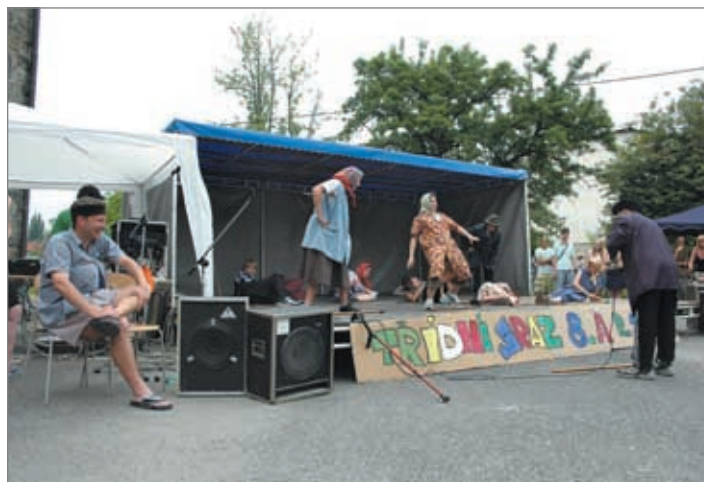
„V zdravém těle zdravý duch“ bylo téma letošního už sedmého školního Jarmarku ZŠ T. G. Masaryka. V jeho závěru bylo předáno osm výročních školních cen vynikajícím žákům školy.