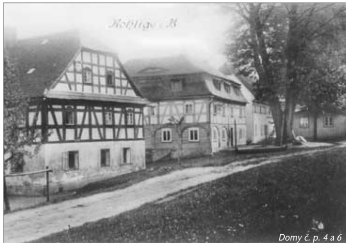
Domy č. p. 4 a 6