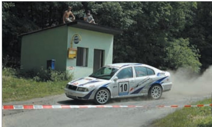
Příznivci motorismu si na své přišli při Rallye Lužické hory, která se po loňském znovuzrození jela v okolí Hrádku a Frýdlantu letos již po deváté.