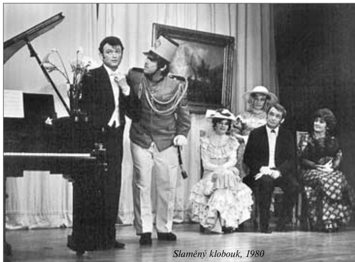
Slaměný klobouk, 1980

nadále hraje pod hlavičkou DS Vojan. V následujících ročnících HDP se například představil s úspěšnými inscenacemi Ženitba, Sluha dvou pánů, Blázinec v 1. poschodí a Slaměný klobouk.