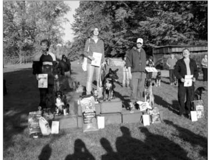
Vítězové kategorie ZM

ZKO Kynologický klub Hrádek n. N., www.kynologickyklubhradek.pescz.cz