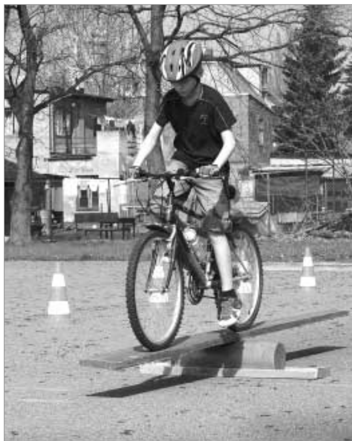
Městští strážníci ve spolupráci s DDM Drak uspořádali pro hrádecké děti jízdu zručnosti